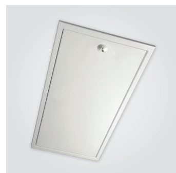
Revisionsklappe für den Deckeneinbau, ohne Treppe